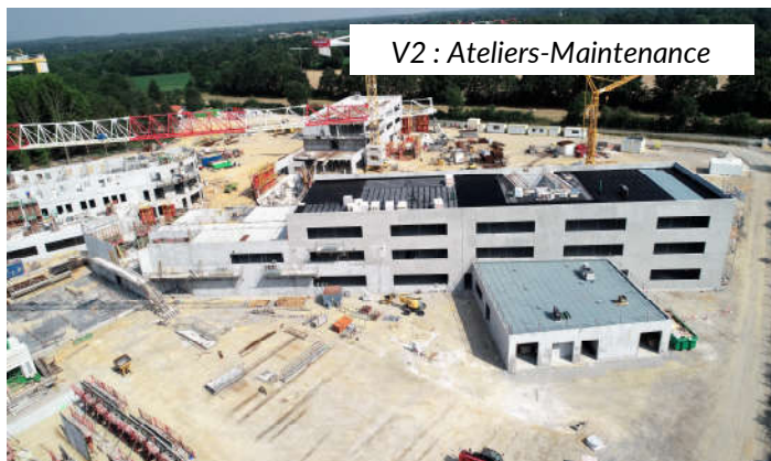
V2 : Ateliers-Maintenance