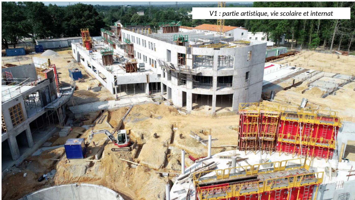
V1 : partie artistique, vie scolaire et internat