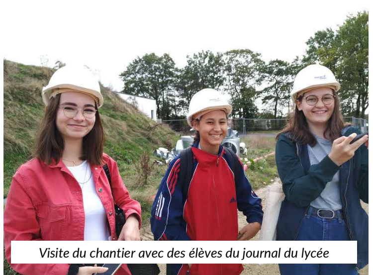
Visite du chantier avec des élèves du journal du lycée