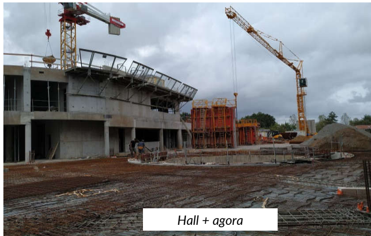
Hall + agora