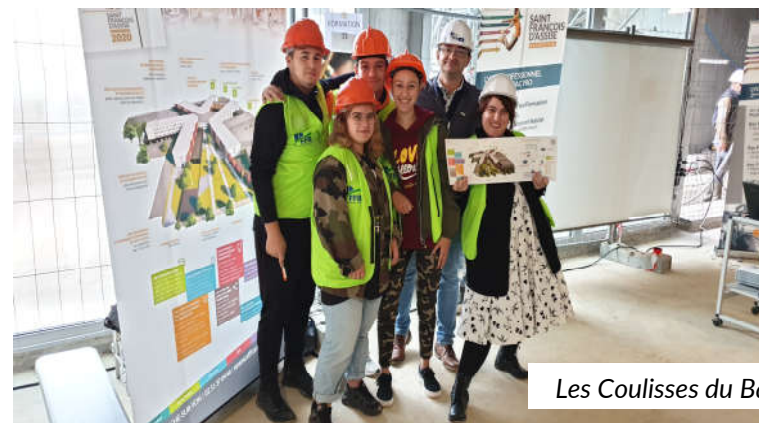
Les Couloirs du Bâtiment avec la FFB