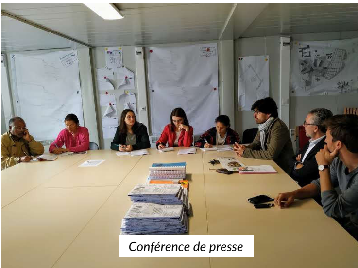
Conférence de presse