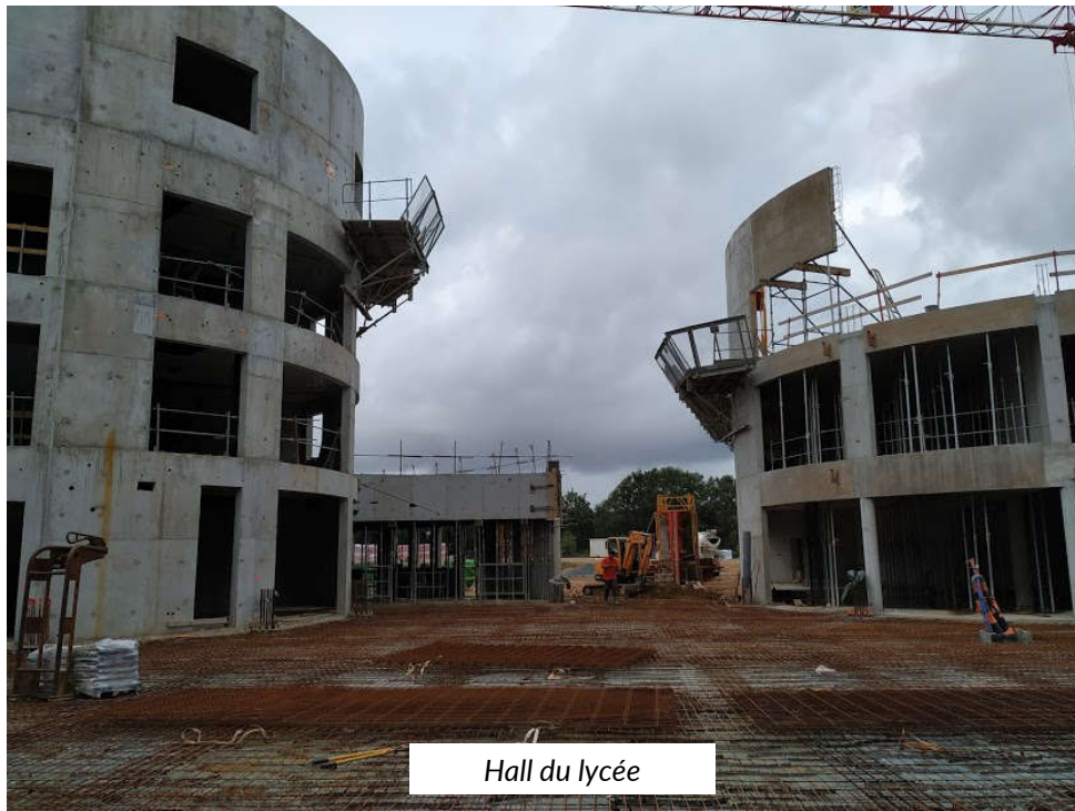
Hall du lycée